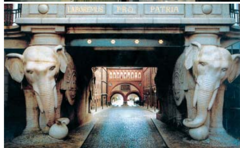
Den nye bydel på den gamle bryggerigrund i Valby skal spille sammen med brygger Jacobsens kunst og gamle bygninger.

by, er bryggerigrunden det sted, hvor Carlsberg blev født.